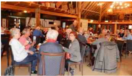
Boven: 'Boerenlunch' Rechts: beugelbaan, boogschieten